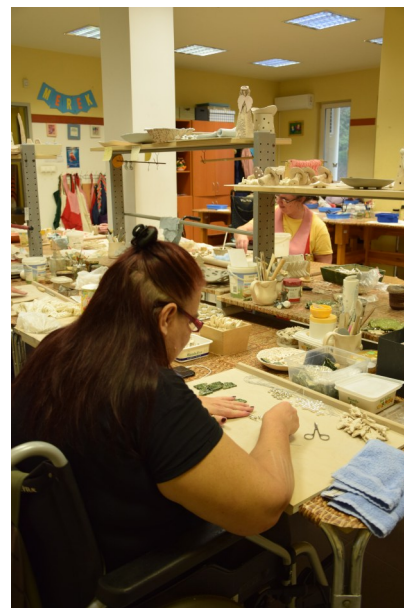
Készülnek az ünnepi díszek