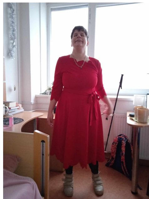
„Piroska” és az ominózus viselet