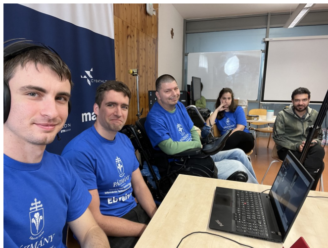
A bionikus aranycsapat, köztük a szerző