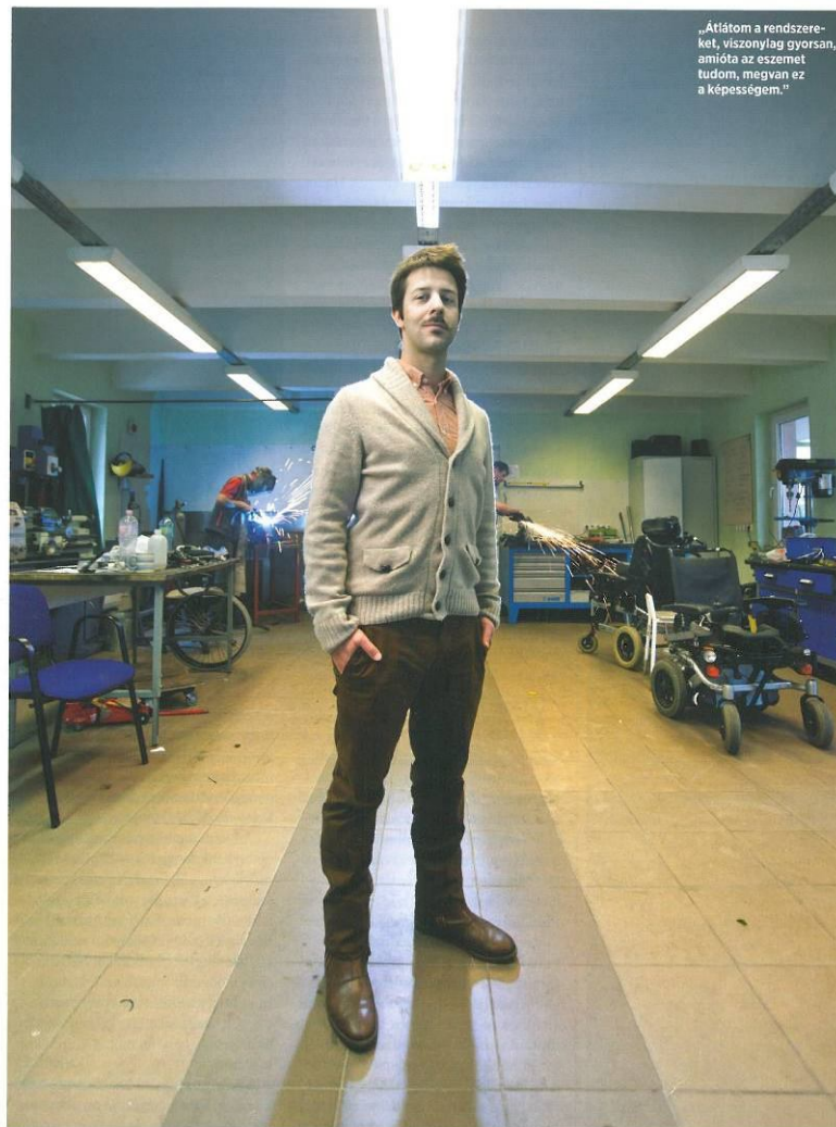
„Átlátom a rendszereket, viszonylag gyorsan, amióta az eszemet tudom, megvan ez a képességem.”

„Műszerezzünk!” – ez volt édesapja varázsszava, aki már 1989-ben csicszámitógépet rakott össze a fiának. „Rájöttem, hogy csak univerzális tudással lehet létrehozni komplex dolgokat.” A felfedezés öröme hamarosan összeért a tudományos gondolkodással. Jó gyerek volt, tele kreativitással és energiával. Tanárai figyelembe vették különbségét, ezért osztályfőnöke arra biztatta, hogy a kreatív gondolkodásnak teret hagyó, szabadabb elvrű gimnáziumot válassza. Később mégis rettegett az egyetemi felvételitől: „Azt gondoltam, ha nem vesznek fel, akkor egy senki vagyok, nem teljesítem a velem szemben támasztott, szerintem irreális elvárásokat.” A félt vereséget elkerülendő elindult első szabadalmának terével egy innovációs versenyen. Ötlethez az Egyesült Államokból rendelt olyan izomhuzalokat, amelyeket a NASA használt a Marsjáróban, ezeket integrálta a szombathelyi főiskoláról elkért műanyag csontokra. A csontokba folyékony lítium-polimer akkumulátorokat tervezett, ezután nemcsak megálmodta, de meg is építette a még hiányzó kiberdinamika-processzort. Alkotott egy művegtagot, ami